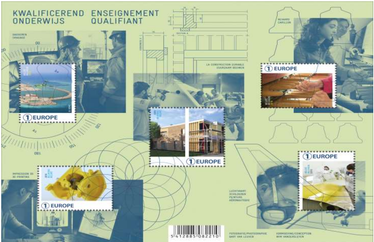
La Belgique qui gagne : L'enseignement qualifiant en Belgique et son rayonnement international