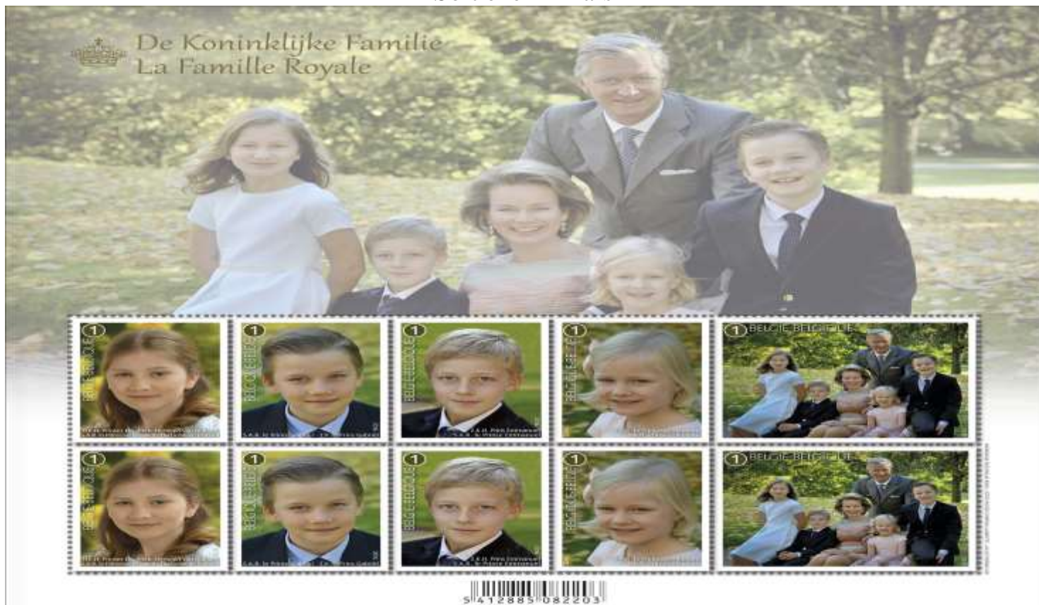
La Famille Royale : Les enfants de L.L.M.M, le Roi et la Reine