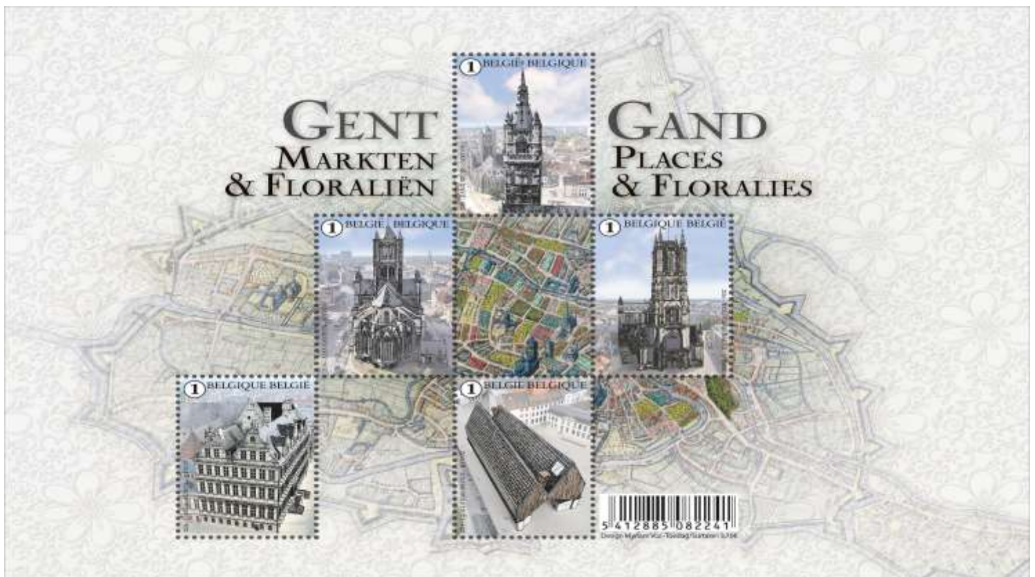
Gand : Places et Floralties – Place de Gand et les Floralties (Promotion de la Philatélie) Avec un motif floral à l'arrière-plan du feuillet