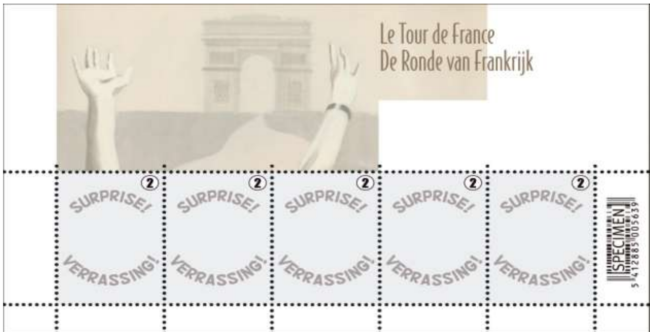
Hommage à Eddy Merckx