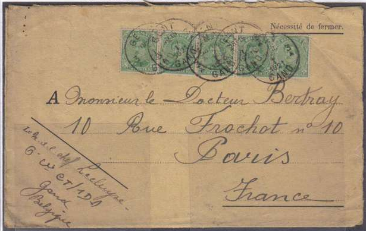
Bande de 2x2 plus 1 du n°137 type 2 oblitération de Gand bilingue vers Paris ( France) de 1-1921 Port 25 centimes (5 x 5 centimes ) vers l'étranger Verso oblitération d'arrivée Paris IX rue Hippolyte Lebas