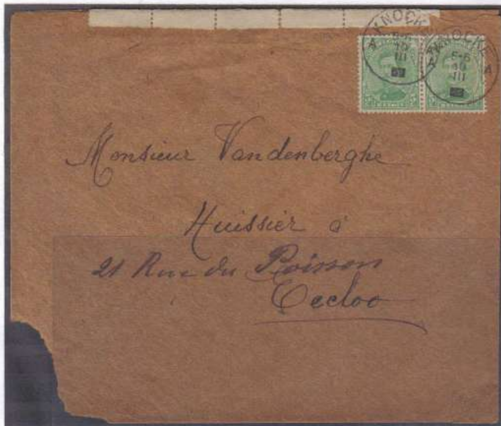
Envoi de Knocke oblitération du 10-3-année bloquée sur n° 137 type 1 Port de 10 centimes (2x 5 centimes) Verso cachet de Eecloo du 10-3-