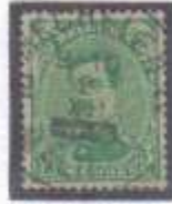
n°137 type 5 Année bloquée, cachet de Mechelen