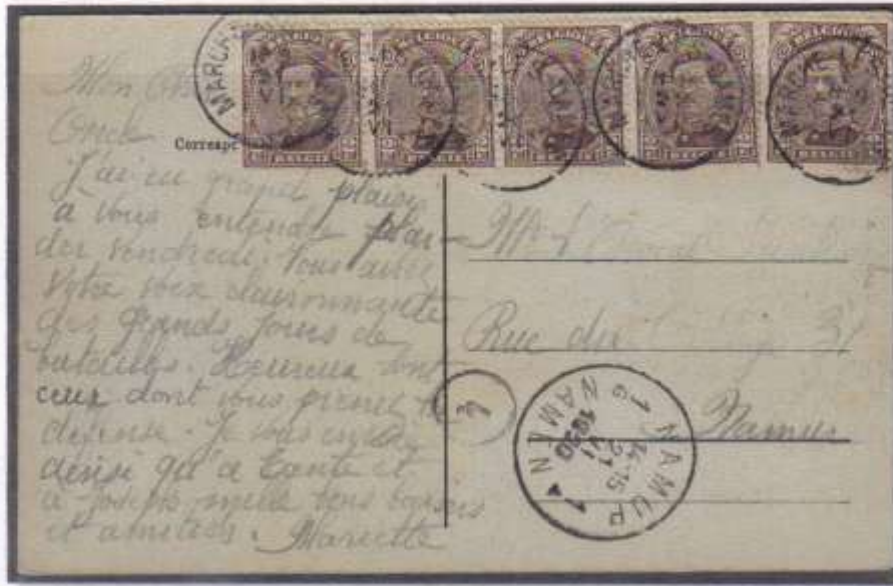
Bande de 4 plus 1 du N°136 type 2 Oblitération de Marche les Dames 21.06.1920 Vers Namur oblitération arrivée 21.06.1920, port 10 centimes