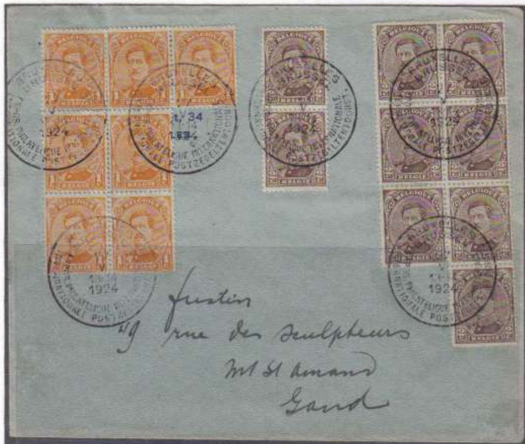
Oblitération d'exposition philatélique internationale de Bruxelles du 27-5-1924 sur bloc de 7 du n° 135 type 1 sur paire verticalement et bloc de 7 du n° 136 type 2 Port de 25 centimes depuis le 15-11-1923 vers Gand