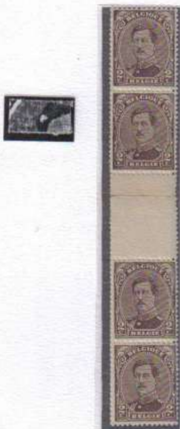
Bande de 4 n°136 type 1 inter panneau Timbre n°2 tache blanche sur le toupet à gauche