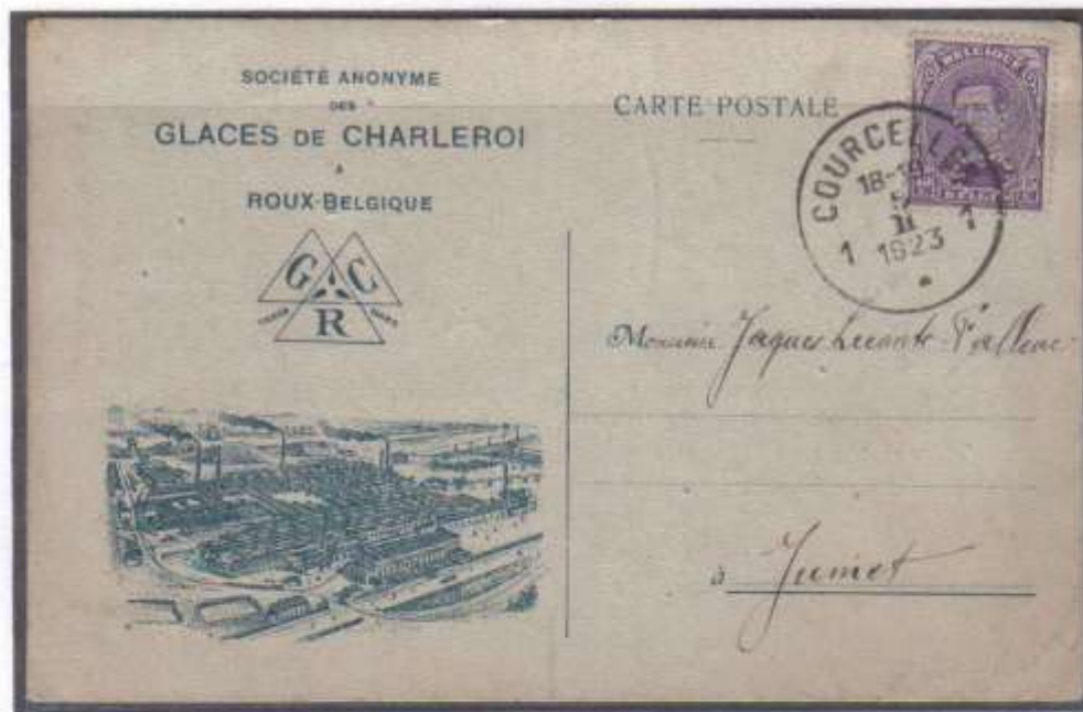
Carte de Courcelles vers Jumet oblitération du 5-2-1923, sur n° 139 type 2 Changement de port du 15-12-1919, 15 centimes par 20 grammes Timbre perforé G C ( glacerie de Charleroi )