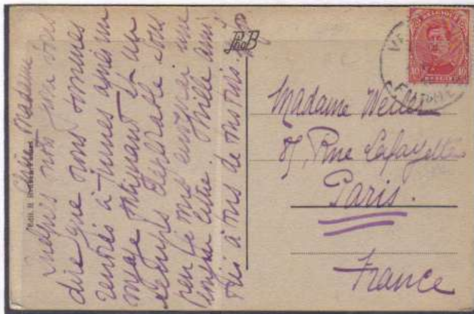
Carte vue oblitération de Furnes bilingue du 7/./1917 sur n°138 type 1 vers Paris (France) port 10 centimes