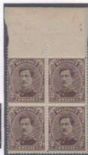
Bord de feuille de l'inter panneau Bloc de 4 n° 136 type 1 Timbre n°3 grosse tache blanche Mutilant le cadre droit du cartouche