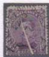
Plis accordéon Timbre n°139 type 1 B de Belgique blanc dans sa partie supérieure