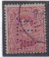
138 type 1 Perforation A.D