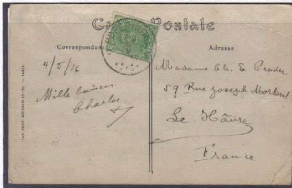
Carte vue oblitération de Poperinghe 6/5/1916 sur n°137 type 1 vers Le Havre (France) port 5 centimes