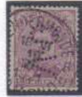
140 type 1 perforation V-G