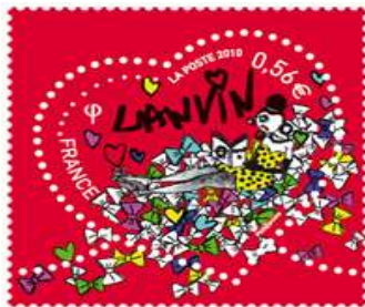
Exemples de Timbres Français

Une autre origine de la Saint-Valentin, enfin, remonte au Moyen-âge. On dit en effet qu'à cette époque une croyance se répandit en France et en Angleterre selon laquelle la saison des amours chez les oiseaux débutait le 14 février et que, prenant exemple sur eux, les hommes trouvèrent ce jour propice à la déclaration amoureuse. C'est ainsi que depuis, à la Saint-Valentin, chaque Valentin cherche sa Valentine pour mieux roucouler au printemps