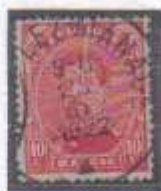
Plis accordéon Timbre n°138 type 1