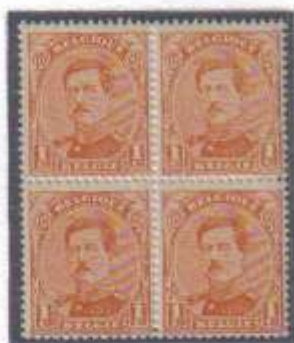
Bloc de 4 n°135 type 2 Timbre n°2 trait blanc au dessus de la raie