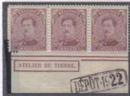
Bord de feuille inférieure n°140 type 4 Atelier du timbre de Malines, dépôt 1922