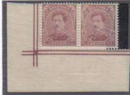
Bord de feuille inférieure gauche du 3ème panneau n° 140 type 4

Les bords de feuille des timbres non surchargé possèdent 2 traits parallèles