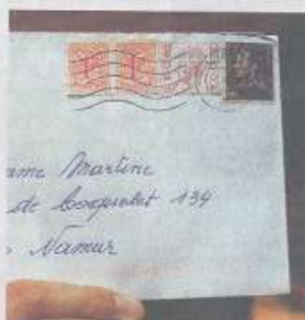
La lettre en question.