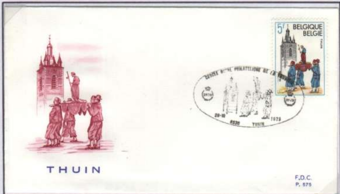
F.D.C. ordinaire du 20 octobre 1979