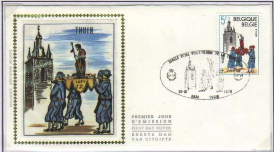
F.D.C. de roie du 20 octobre 1979