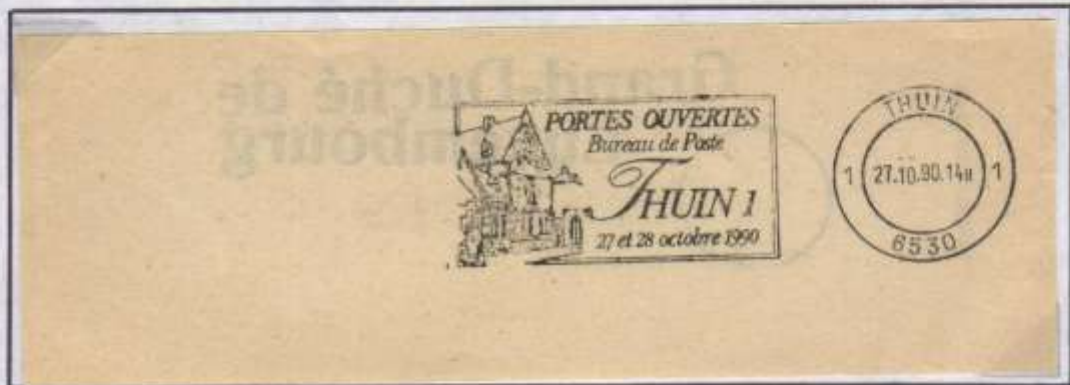
Flamme du 27 et 28 octobre 1990 et oblitération de Thuin 1.