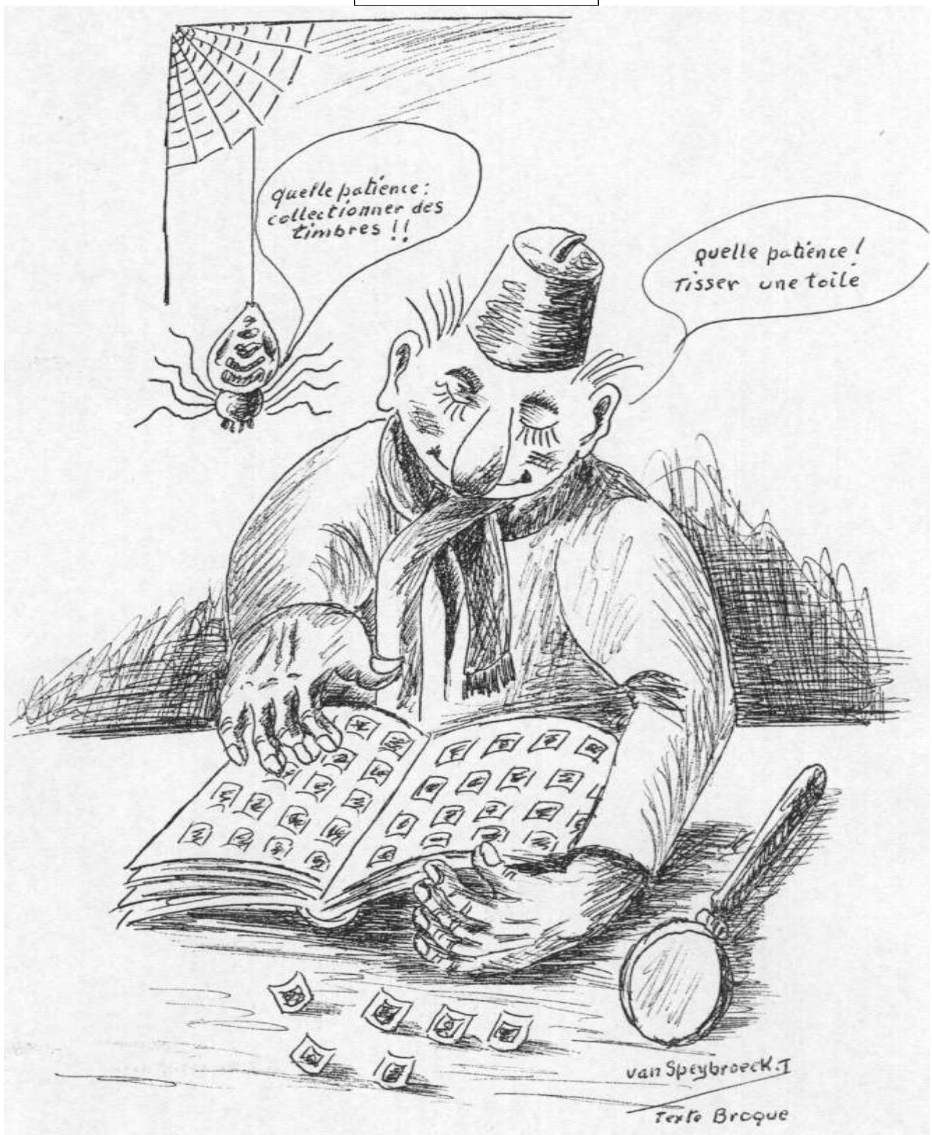
Lu pour vous Caricature créée par Philat' Humour ou une tranche de Foyer d'Herlaimont en sourires Dessin : Jean Van Speybroeck Texte : Broque Edition D'Herlaimont 1984