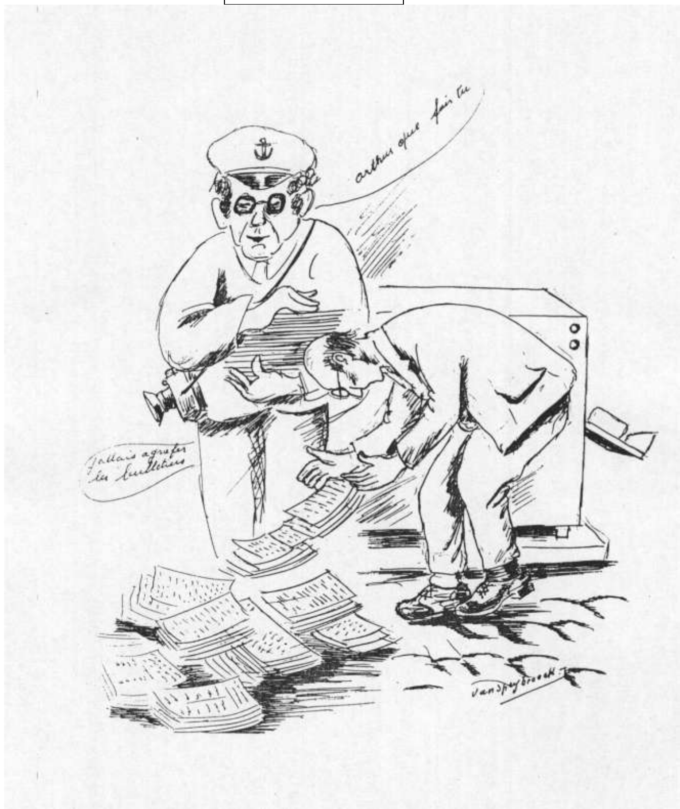
Lu pour vous Caricature créée par Philat' Humour ou une tranche de Foyer d'Herlaimont en sourires Dessin : Jean Van Speybroeck Texte : Broque Edition D'Herlaimont 1984