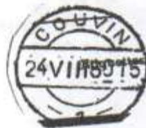
Marque CDC à pont de 25 mm Chiffres arabes