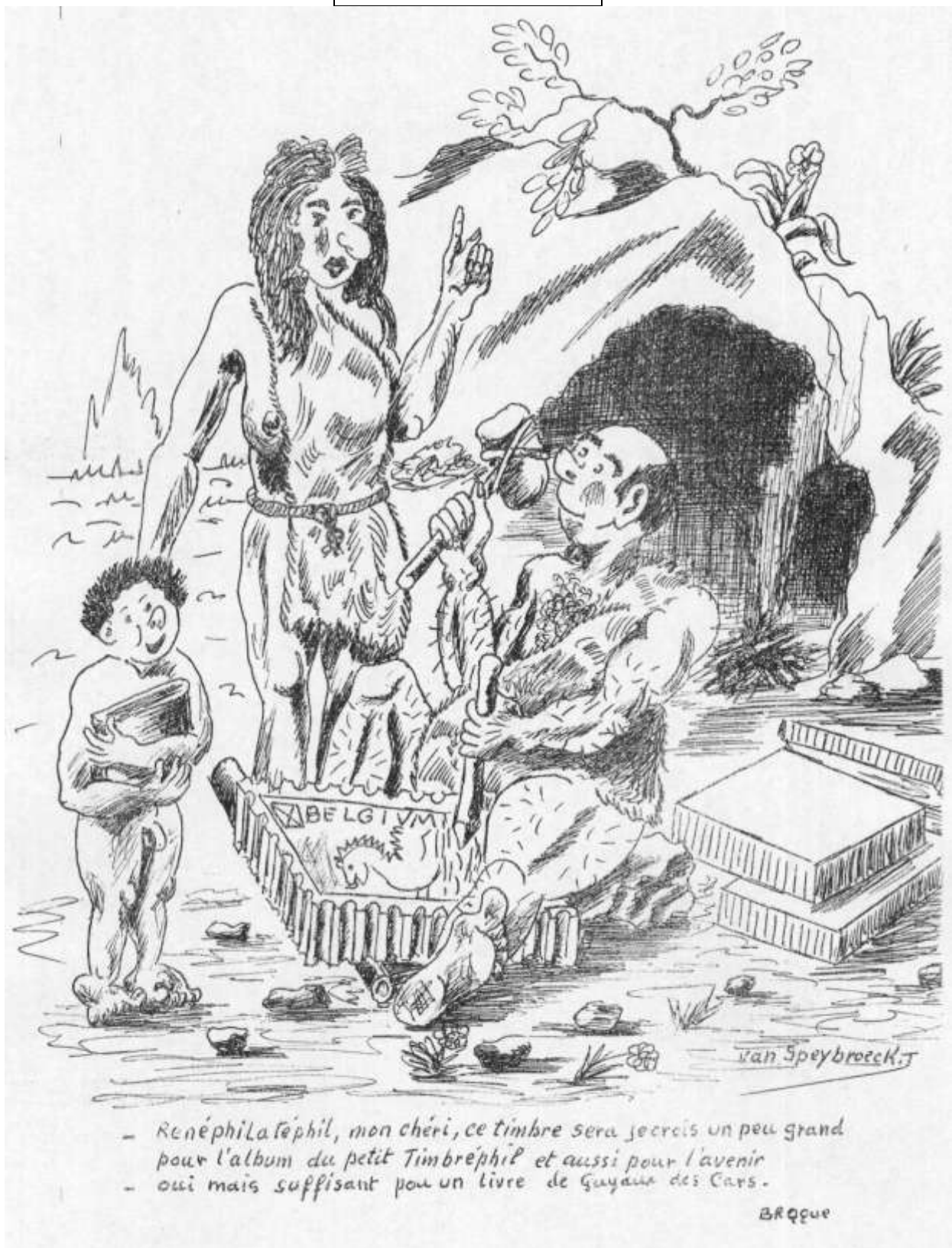
Lu pour vous Caricature crée par Philat' Humour ou une tranche de Foyer d'Herlaimont en sourires Dessin : Jean Van Speybroeck Texte : Broque Edition D'Herlaimont 1984