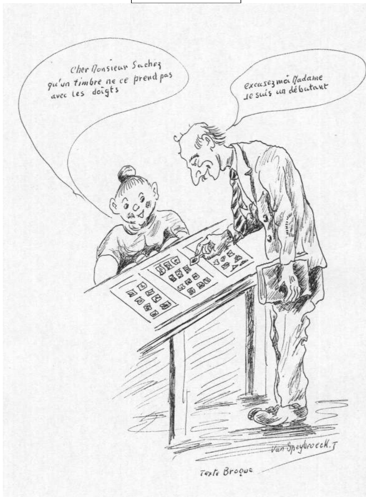
Lu pour vous Caricature créée par Philat' Humour ou une tranche de Foyer d'Herlaimont en sourires Dessin : Jean Van Speybroeck Texte : Broque Edition D'Herlaimont 1984