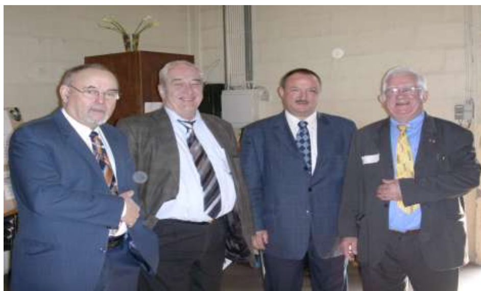
VERNISAGE DE NOTRE EXPOSITION LE 8 AVRIL 2006