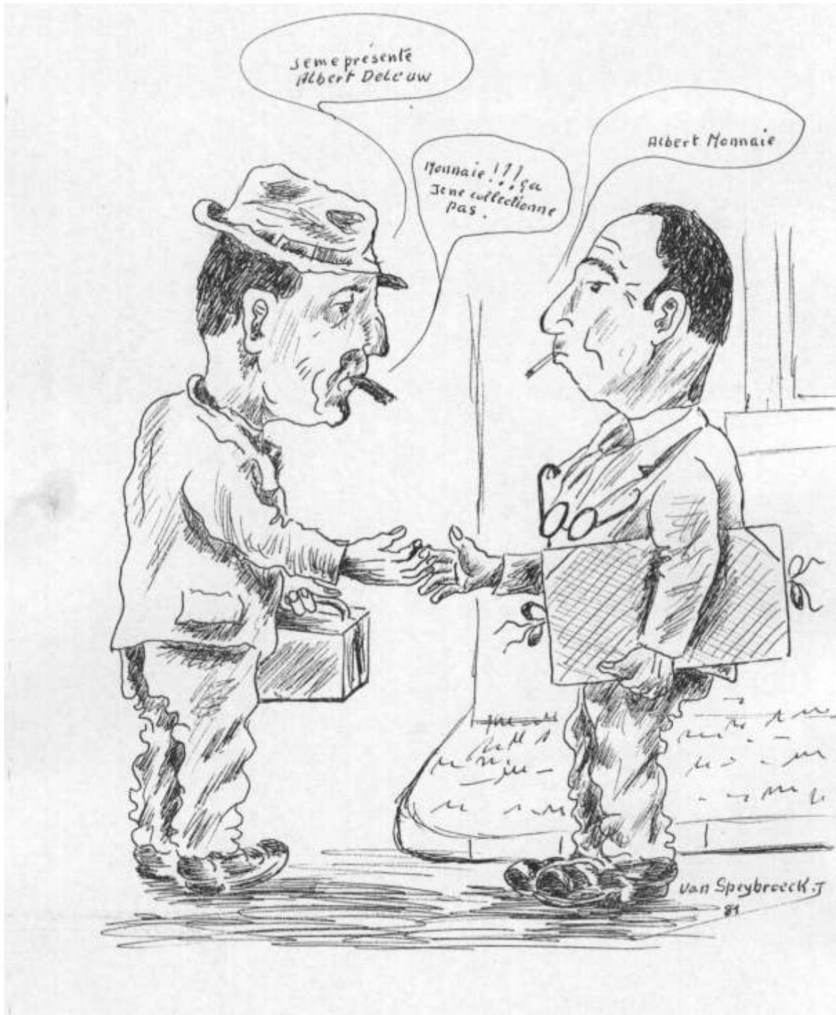
Lu pour vous Caricature crée par Philat' Humour ou une tranche de Foyer d'Herlaimont en sourires Dessin : Jean Van Speybroeck Texte : Broque Edition D'Herlaimont 1984